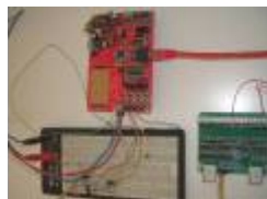
Netzer connected via S88 bus