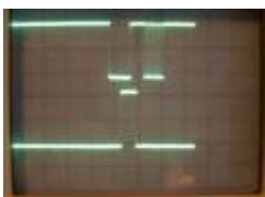
Oscillogram of s88 clock and load