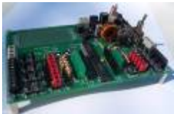
Netzer breakout board - Assembled