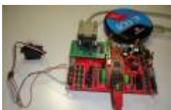
Servo at Netzer Playground