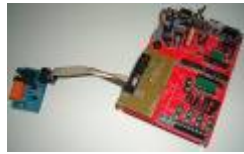
Netzer playground with I2C Expansion board