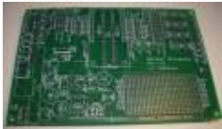
Netzer breakout board - The first PCB