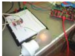
230V phase control