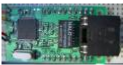
Netzer from top.