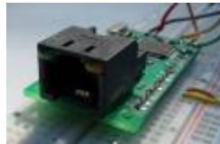
Netzer on a prototyping board.